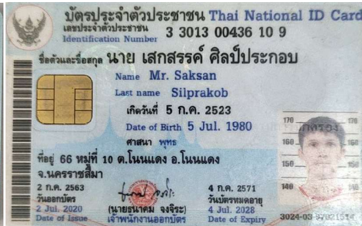
6.นาย เสกสรรค์ ศิลป์ประกอบ