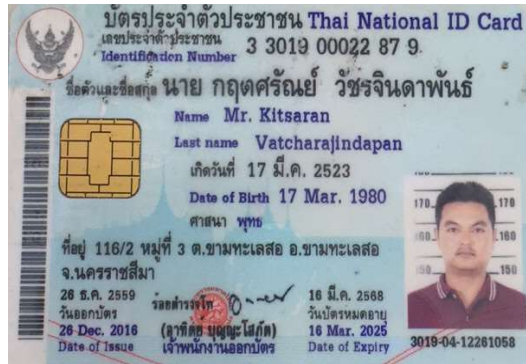
8.นาย กฤตศรัณย์ วัชรจินดาพันธ์