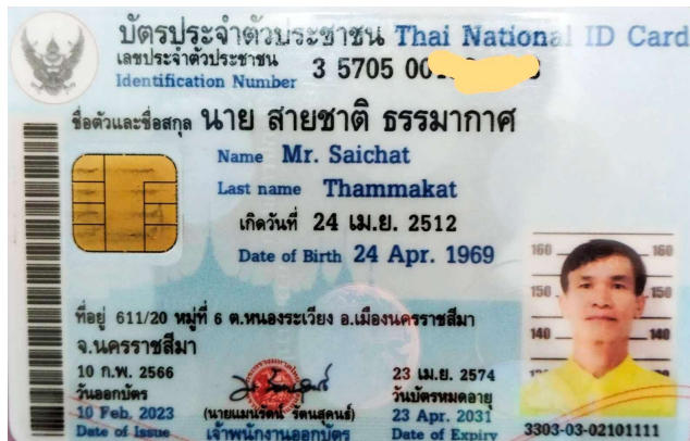
4.นาย พนมกร ยอดอ่อน