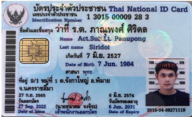
3.นาย ภาณุพงศ์ ศิริดล