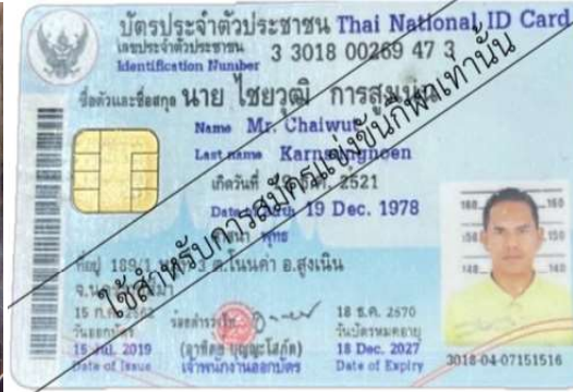
4.นาย ไชยวุฒิ การสูงเนิน