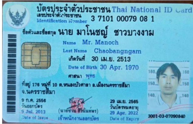
2.นาย มาโนชญ์ ชาวบางงาม