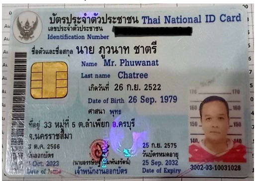
7.นาย ภูวนาท ชาตรี