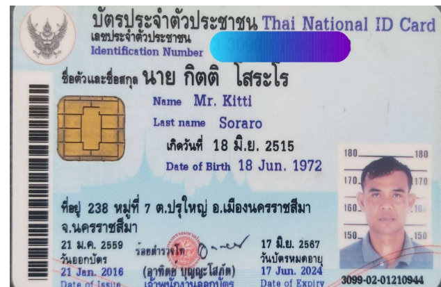
6.นาย กิตติ โสระโร.