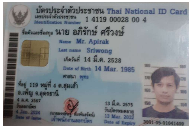
2.นาย อภิรักษ์ ศรีวงษ์