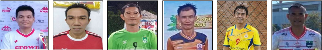
ปัญญา แน่นอุดร ปรีชา นิกกระโทก. มนตรี บุตดาวง สายชิตี ธรรมภาค มาโนชญ์ ขาวบางงาม กิตติ ไสระโร