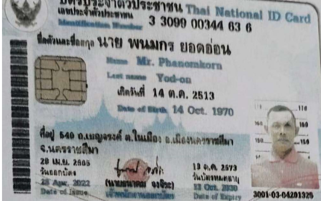
9.นาย พนมกร ยอดอ่อน