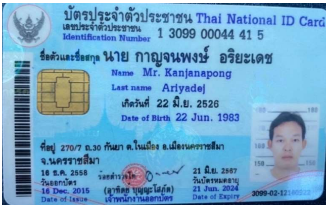
1.นาย กาญจนพงษ์ อริยะเดช