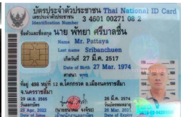
8.นาย พัทยา ศรีบานชื่น