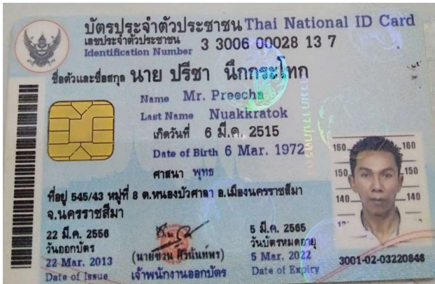
3.นาย ปรีชา นึกกระโทก.