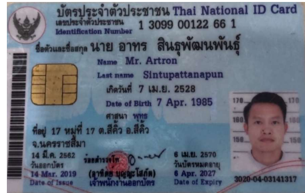
4.นาย อาทร สินธุ์พัฒนพันธ์