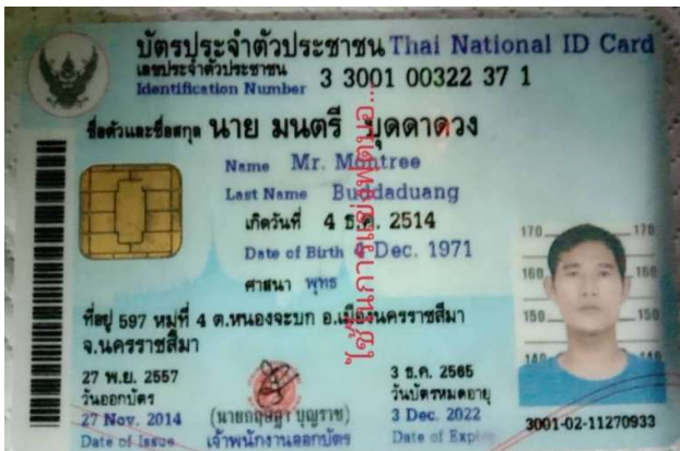
5.นาย มนต์รี บุตดาดวง