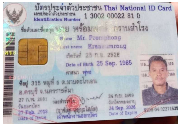
6.นาย พร้อมพงษ์ กรานสำโรง