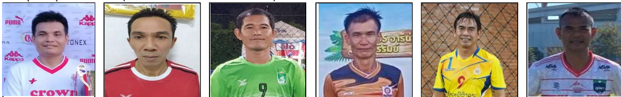
ปัญญา แน่นอุดร ปรีชา นิกกระโทก. มนตรี บุตดาวง สายชาติ ธรรมภาค มาโนชญ์ ขาวบางงาม กิตติ โสระโร