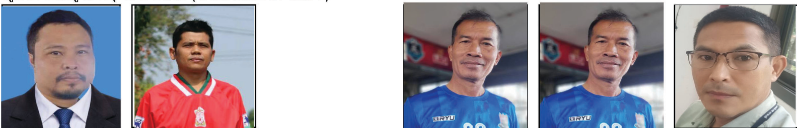
ผู้จัดการทีม.