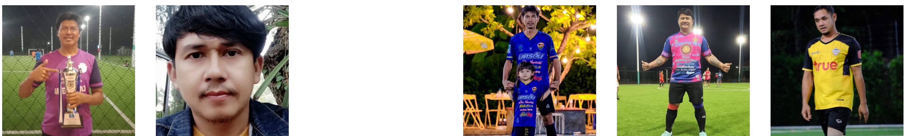
ผู้จัดการทีม.