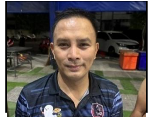
ยูโรป สิมมา