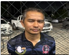
เกียรติศักดิ์ ช่วยฝึกแวน